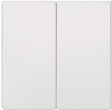
DELTA i-system biały tytanowy klawisz łącznika 2-krotn. neutralny 55x55mm