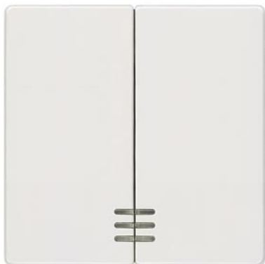
DELTA i-system biały tytanowy klawisz łącznika 2-krotn. z okienkiem 55x55mm