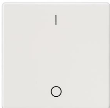
DELTA i-system biały tytanowy klawisz łącznika z symbolem I/O 55x55mm