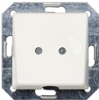
DELTA i-system biały tytanowy płyta wylotowa 55x55mm