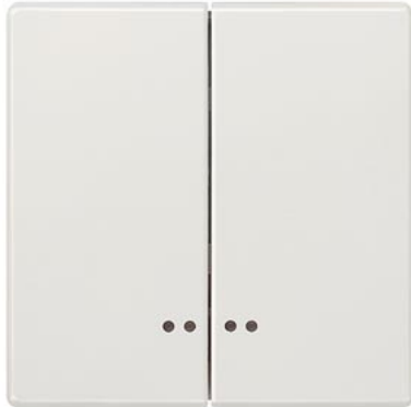
DELTA klawisz łącznika style biały tytanowy 2-krotn. z okienkiem 68x68mm