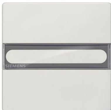
DELTA klawisz łącznika style biały tytanowy z polem tekstowym 68x68mm