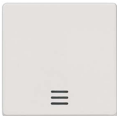
DELTA i-system biały tytanowy klawisz łącznika z okienkiem 55x55mm