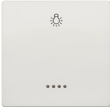
DELTA klawisz łącznika style biały tytanowy z okienkiem i symbolem światła 68x68mm