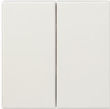
DELTA klawisz łącznika style biały tytanowy 2-krotn. neutralny 68x68mm