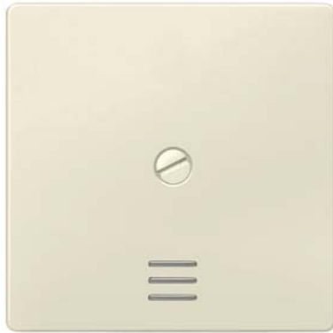
DELTA i-system biały kremowy klawisz łącznika przykręcany z okienkiem 55x55mm