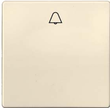
DELTA i-system biały kremowy klawisz łącznika z symbolem dzwonka 55x55mm