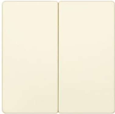
DELTA i-system biały kremowy klawisz łącznika 2-krotn. neutralny 55x55mm