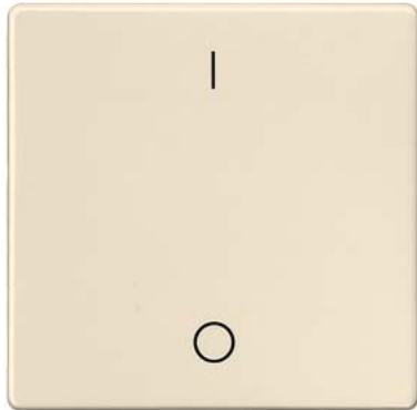
DELTA i-system biały kremowy klawisz łącznika z symbolem I/O 55x55mm