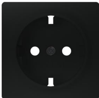
DELTA i-system delikatny czarny SCHUKO 55x55mm 10/16A 250V