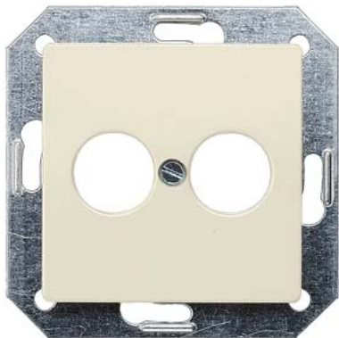
DELTA płyta osłonowa biała tytanowa do małego złącza wtykowego