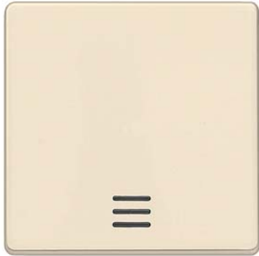
DELTA i-system biały kremowy klawisz łącznika z okienkiem 55x55mm