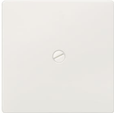
DELTA i-system biały tytanowy klawisz łącznika przykręcany 55x55mm