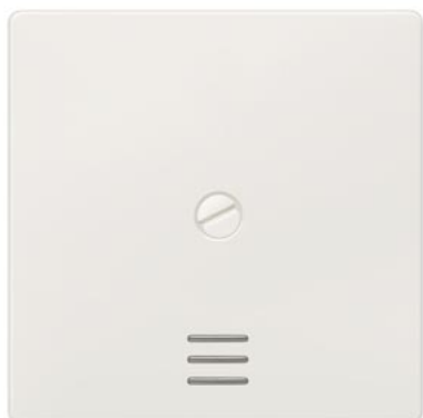
DELTA i-system biały tytanowy klawisz łącznika przykręcany z okienkiem 55x55mm