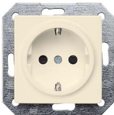
DELTA i-system biały kremowy SCHUKO z zabezp. przed dziećmi 55x55mm 10/16A 250V