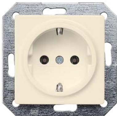
DELTA i-system biały kremowy SCHUKO 55x55mm 10/16A 250V