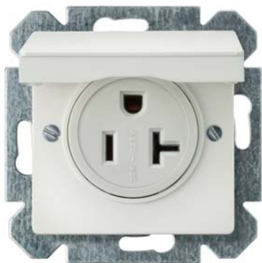
DELTA NEMA SCHUKO biały tytanowy z wieczkiem 2-bieg.+E NEMA 5-20 R 125 V 20 A