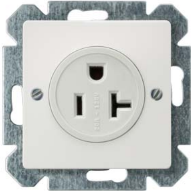
DELTA NEMA SCHUKO biały tytanowy NEMA 5-20 R 125 V 20 A 2-bieg.+E NEMA 5-20 R 125 V 20 A