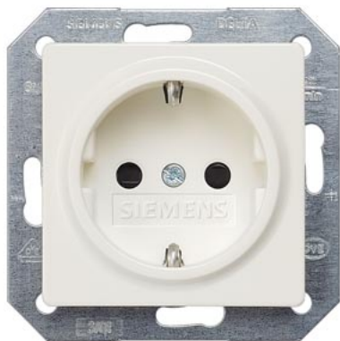
DELTA i-system biały tytanowy SCHUKO z zabezp. przed dziećmi 55x55mm 10/16A 250V