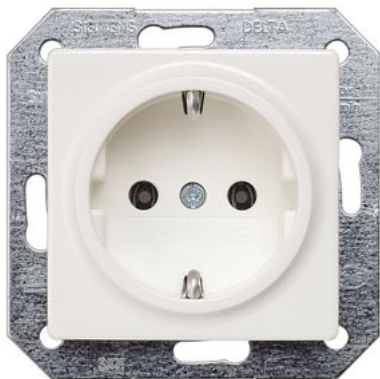
DELTA i-system biały tytanowy SCHUKO 55x55mm 10/16A 250V