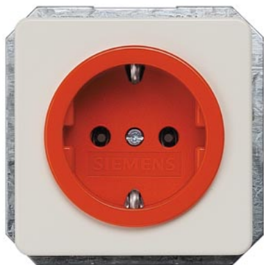
DELTA profil biały tytanowy SCHUKO wgłębienie pomarańczowe(ZSV) 10/16A 250V 65x 65mm