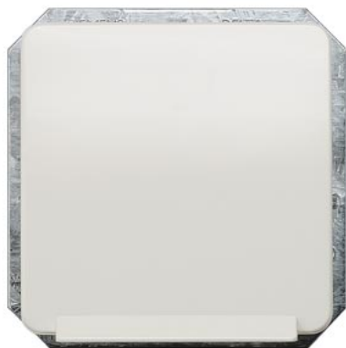
DELTA profil biały tytanowy SCHUKO z wieczkiem 65x 65mm