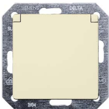
DELTA i-system biały kremowy SCHUKO z wieczkiem 55x55mm 10/16A 250V