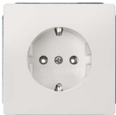
DELTA style biały tytanowy SCHUKO 68x68mm 10/16A 250V