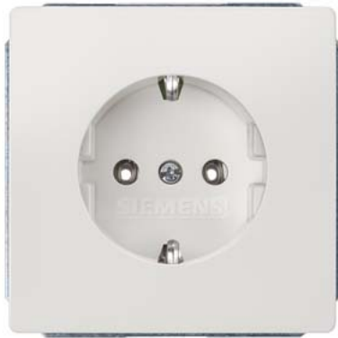
DELTA style biały tytanowy SCHUKO bez zaczeów 68x68mm 10/16A 250V