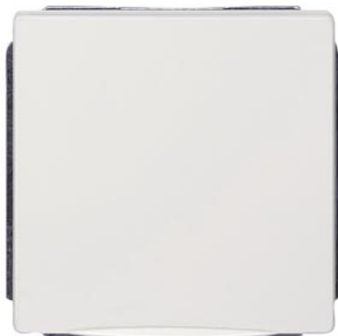
DELTA style biały tytanowy płyta osłonowa z wieczkiem 68x68mm 10/16A 250V