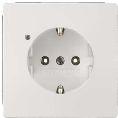
DELTA style biały tytanowy SCHUKO ze wskaź. rob. 68x68mm 10/16A 250V