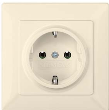
DELTA line biały kremowy SCHUKO płyta pełna 80x80mm 250V AC, 16 A